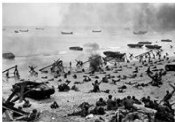
Débarquement du 6 juin 1944 à Swordbeach