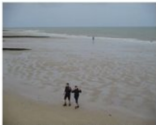
Débarquement du 18 mars 2019 à Swordbeach

Lundi 18 mars la classe relais est parti manger sur la plage de Swordbeach à Luc sur mer. Cette plage est la plage où a eu lieu le Débarquement de Normandie durant la seconde guerre mondiale. Le 6 juin 1944 le débarquement avait pour but de libérer l'Europe du nazisme.